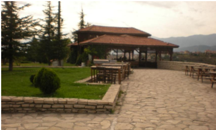
Hıdırlık'ın kentin seyir tepesi ya da terası olarak düzenlemesi sonrası görünümü