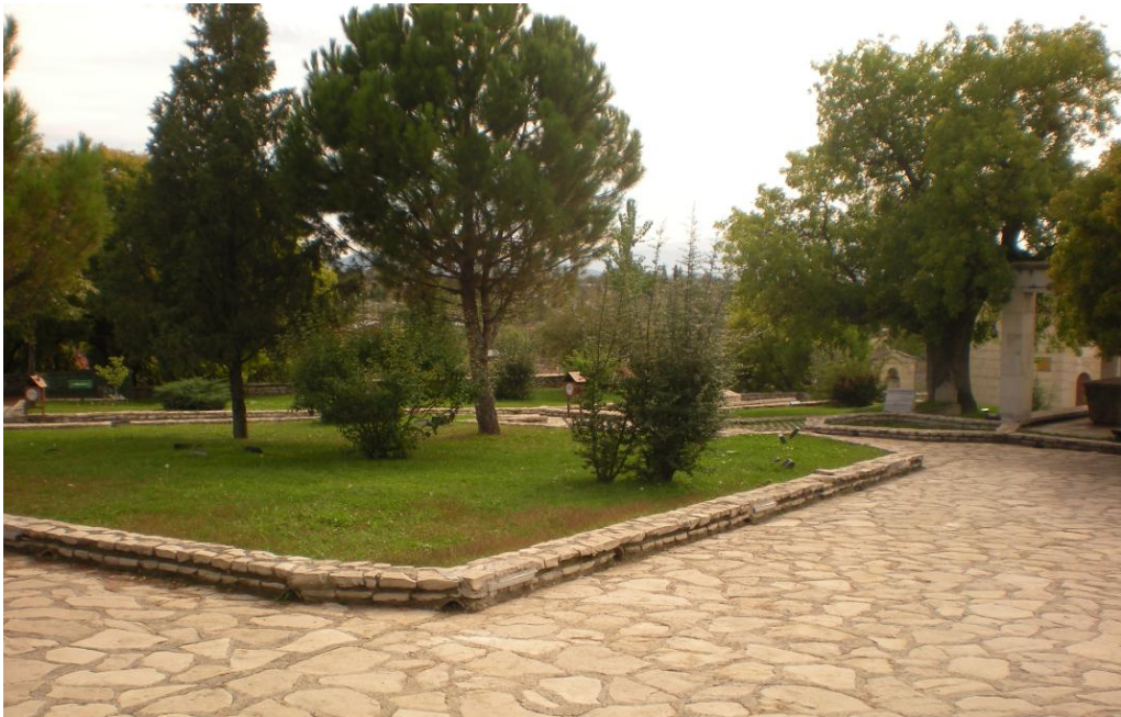
Safranbolu Hıdırlık'ı, yeni düzenlemeler sonrasında bir park görünümü almıştır

Hızır ve Hidrellez'in kökenini, eski Mezopotamya ile Anadolu kültür ve dinlerine bağlayanların da bulunduğu, İslamiyet'ten önce Orta-Asya'daki bahar ve yaz ayınlarını, Türklerin İslamiyet'ten sonra, Hızır ile İlyas'ın buluşması şerefine düzenledikleri şenliklere dönüştürdüğü (sayfa:145 ve devamı) açıklandıktan sonra, aynı kitapta, “ Anadolu'nun her tarafında hidrellez merasimleri şehir, kasaba ve köylerin yakınındaki ağaçlık ve yeşillik yerlerde yapılır... bu nitelikleri taşıyan Hıdırlık (Hızırlık) yerleri bulunur ” (sayfa: 154-155) denilmektedir.