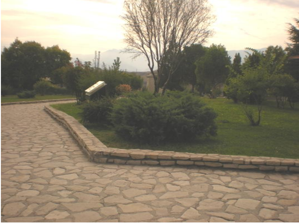
Arapça anlamıyla bağdaşır biçimde yeşillendirildikten sonra Hıdırlık'tan bir kesit

Eski dönemlere ilişkin bu veriler, Hızır ile Hıdır'ın aynı kişi olduklarını göstermenin yanı sıra, Hidrellez kutlamalarının yapıldığı alanlara, Hıdır'ın adına izafeten Hıdırlık denilirken; Hızır'ın adına izafeten de Safranbolu'daki Hıdırlık'a, Hızırtepe; Hidrellez'e de Hızırilyas günü de denildiğini kanıtlamaya yaramaktadır.